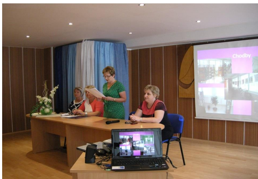
Pedagógovia a žiaci našej školy