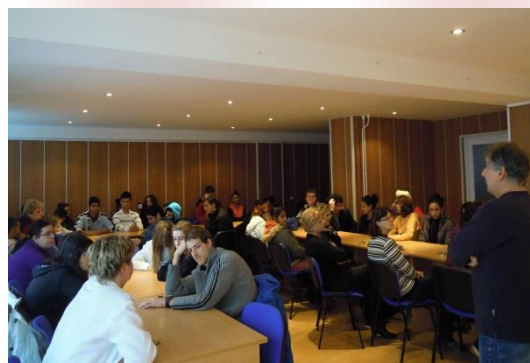
Premietanie videofilmu „Príbehy anjelov“